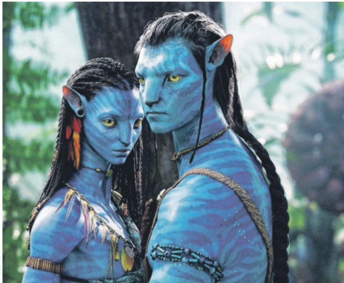
Avatar 2 : les producteurs innovent, alliant production passée et présente.

Cette bande-annonce a suscité de nombreuses appréciations positives et des exclamations dans la salle de cinéma où elle a été diffusée. Disney a tenu compte, et c'est une innovation capitale,